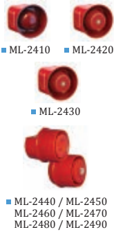
■ ML-2410 ■ ML-2420