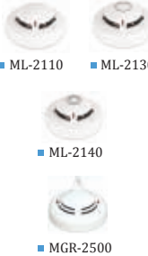
■ ML-2110 ■ ML-2130